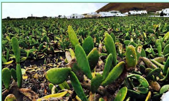
Campo de tuneras en Guatiza

Los lugares en donde pueden verse campos de tuneras más fácilmente son Mala y Guatiza. A continuación les explicaré un poco mejor cómo es el proceso del cultivo de la Cochinilla.