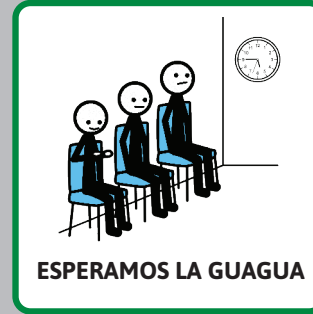
ESPERAMOS LA GUAGUA