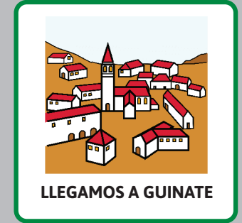
LLEGAMOS A GUINATE