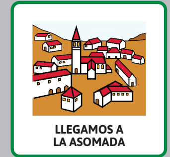
LLEGAMOS A LA ASOMADA