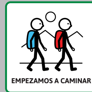
EMPEZAMOS A CAMINAR