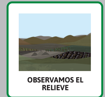
OBSERVAMOS EL RELIEVE