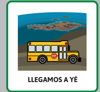
LLEGAMOS A YÉ