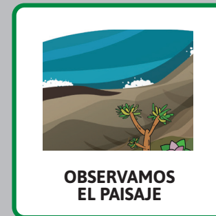
OBSERVAMOS EL PAISAJE