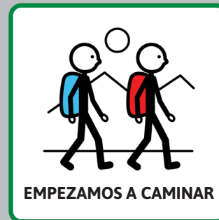
EMPEZAMOS A CAMINAR