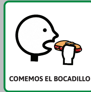
COMEMOS EL BOCADILLO