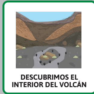
DESCUBRIMOS EL INTERIOR DEL VOLCÁN