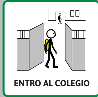
ENTRO AL COLEGIO