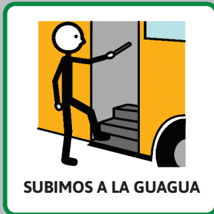
SUBIMOS A LA GUAGUA