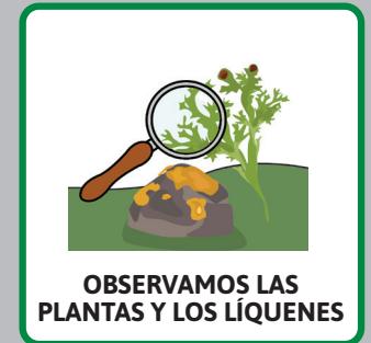
OBSERVAMOS LAS PLANTAS Y LOS LIQUENES