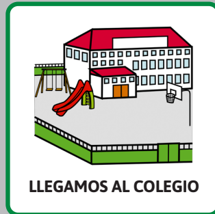
LLEGAMOS AL COLEGIO