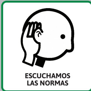
ESCUCHAMOS LAS NORMAS