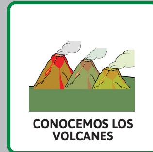
CONOCEMOS LOS VOLCANES