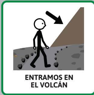
ENTRAMOS EN EL VOLCÁN