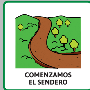
COMENZAMOS EL SENDERO