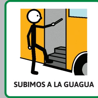
SUBIMOS A LA GUAGUA