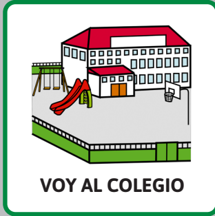
VOY AL COLEGIO