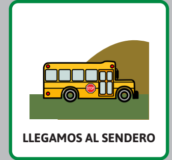
LLEGAMOS AL SENDERO