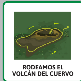
RODEAMOS EL VOLCÁN DEL CUERVO