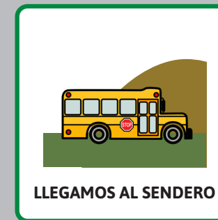
LLEGAMOS AL SENDERO