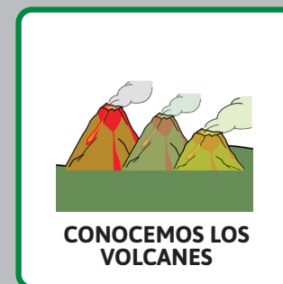
CONOCEMOS LOS VOLCANES