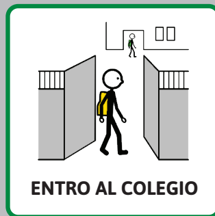
ENTRO AL COLEGIO