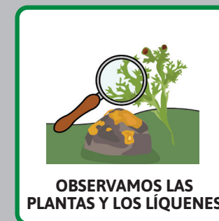
OBSERVAMOS LAS PLANTAS Y LOS LIQUENES