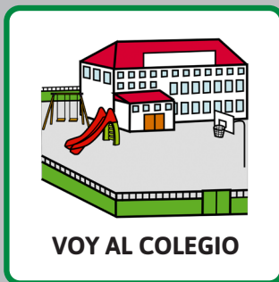
VOY AL COLEGIO