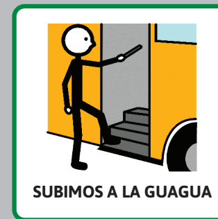
SUBIMOS A LA GUAGUA