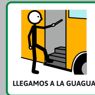
LLEGAMOS A LA GUAGUA