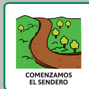
COMENZAMOS EL SENDERO