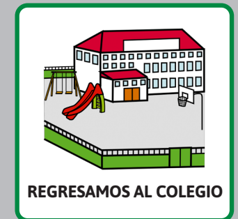
REGRESAMOS AL COLEGIO