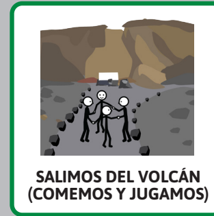
SALIMOS DEL VOLCÁN (COMEMOS Y JUGAMOS)