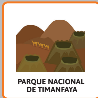
PARQUE NACIONAL DE TIMANFAYA