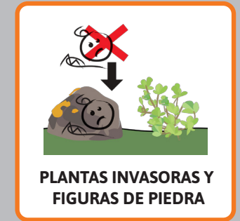
PLANTAS INVASORAS Y FIGURAS DE PIEDRA