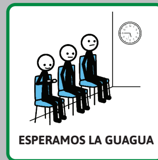
ESPERAMOS LA GUAGUA