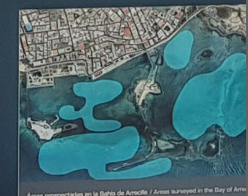
Áreas prospectadas en la Bahía de Arrecife / Areas surveyed in the Bay of Arrecife

To bring this submerged heritage into use, underwater prospecting and excavation work was carried out, to identify, establish protective measures and increase knowledge of the history intended to be more widely known. On Lanzarote, work has focused on La Graciosa, El Río and the Bay of Arrecife.